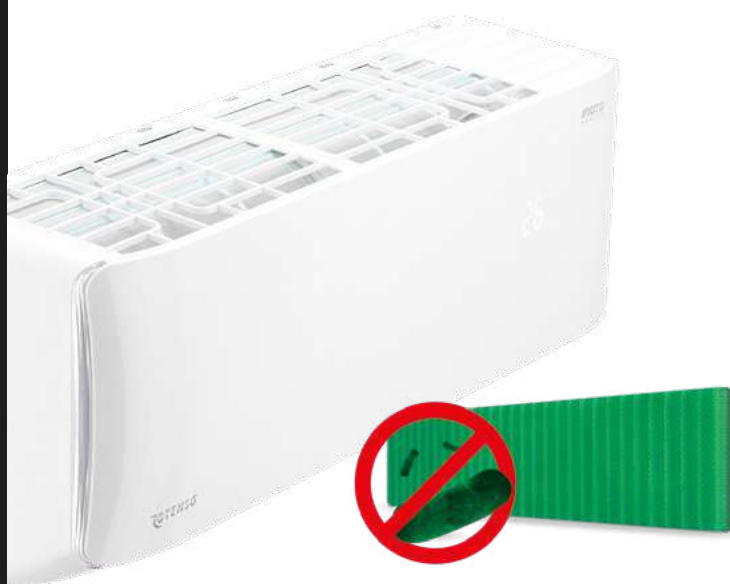
FILTR ANTYBAKTERYJNY iAIR